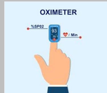
Máy đo SPO2 cầm tay