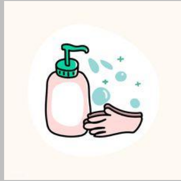
Nước sát khuẩn