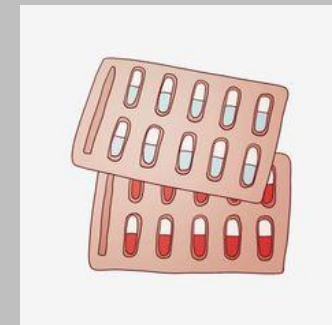
Thuốc hạ sốt dạng uống, đặt hậu môn , Oresol, thuốc ho, vimatin tổng hợp