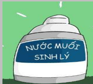
Nước muối sinh lý